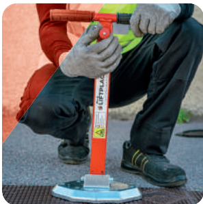
ÉTAPE 1 Ajuster le manche à l'aide du bouton de réglage