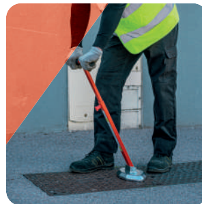
ÉTAPE 3 Pour le décrochage de l'aimant, abaisser le manche contre la butée