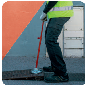
ÉTAPE 2 Aimer au bord, lever légèrement et tirer en faisant glisser la plaque au sol