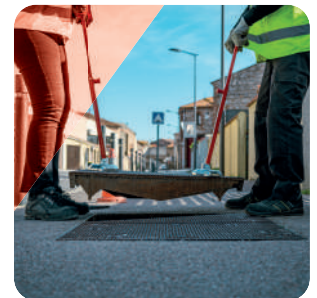
ÉTAPE 4 Possibilité de manipuler avec 2 MINI-LIFTPLAQ®+